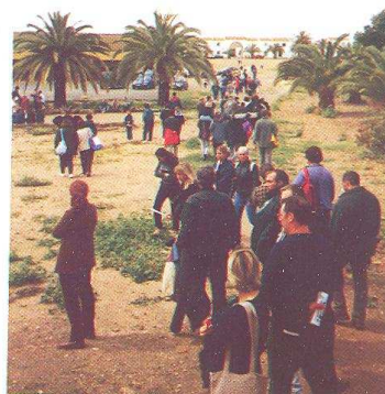
OCUPACIÓN DE LA FINCA CASTILLO DE LA MONCLORA, EL 1º DE MAYO